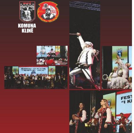
KLINË - KOSOVË