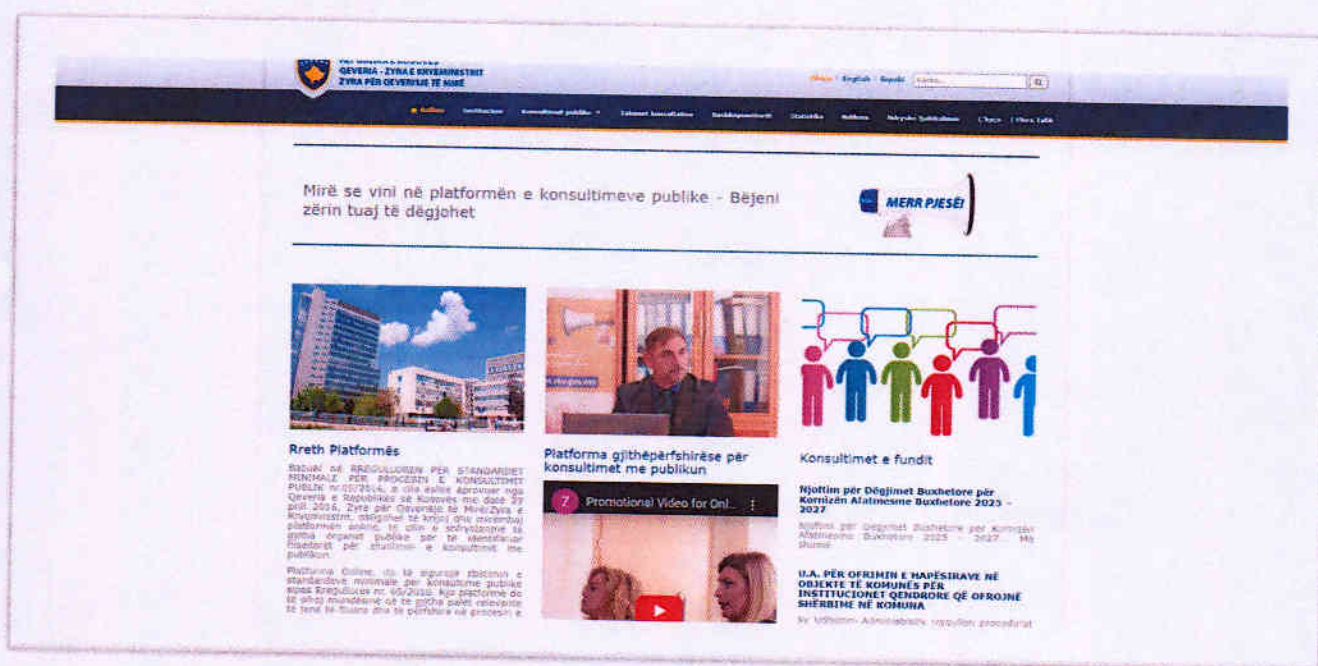
Shtojca nr. 3 – Tabela e detajuar e metodologjisë së dëgjimeve:

https://kk.rks-gov.net/kline/wp-content/uploads/sites/15/2024/05/634-Klina-DRAFT-KAB-2025-2027.docx