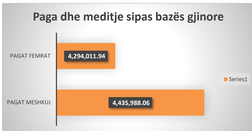
Fig.Tab.13 Paga dhe meditje sipas bazës gjinore