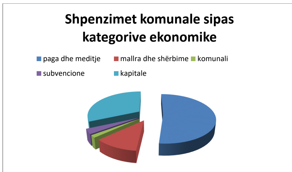
Figura 3: Shpenzimet komunale të planifikuara sipas kategorive ekonomike për 2025