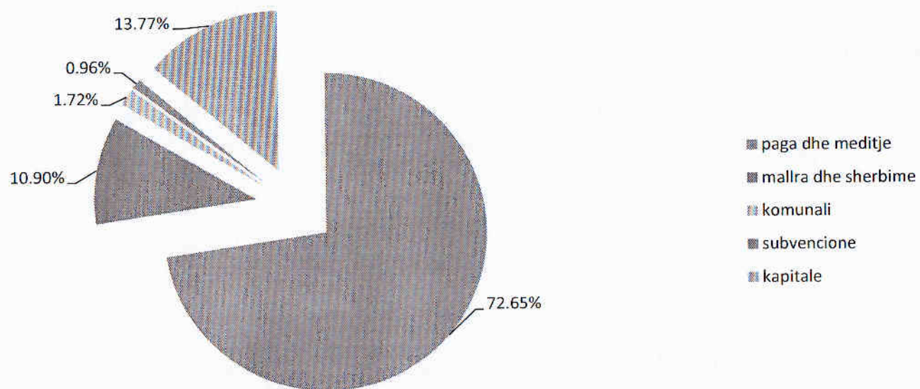
Grafiku 2. Shpenzimet buxhetore në periudhen janar – qershor 2019 sipas kategorive