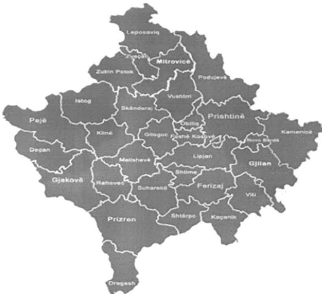
Pozita e Klinës në hartën e Kosovës

Klina si komunë ka pozitë të përshtatshme gjeografike dhe ekonomike, shtrihet në perëndim të Kosovës, në veri-lindje të Rrafshit të Dukagjinit. Komuna e Klinës ka sipërfaqe prej 308.8 km 2 . Kufizohet me këto komuna: Pejë, Istogun, Skënderajn, Drenasin, Malishevën, Rahovecin dhe Gjakovën.