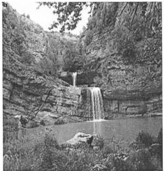
Pamje nga Parku “Ujëvarat e Mirushës”